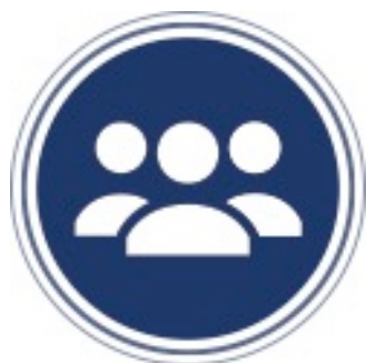
Flexibele schil om bezetting