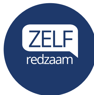
10 zelfredzaamheid projecten